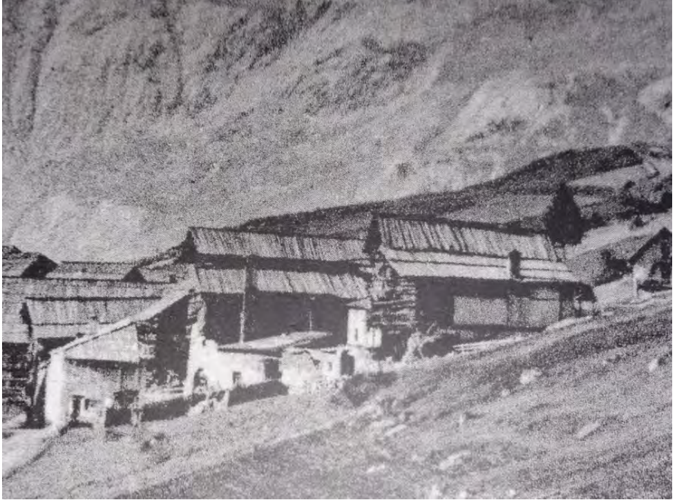
Le paysage d'époque, une illustration de la vie dans le Queyras.